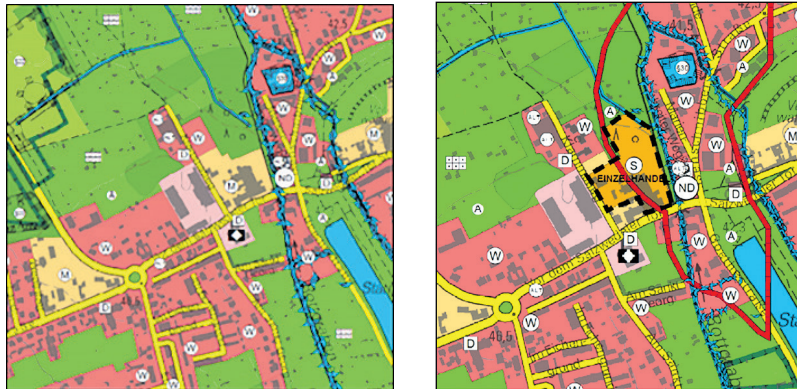
Abbildungen: Änderung Mischbaufläche in Sonderbaufläche Einzelhandel (Quellen: Flächennutzungsplan der Hansestadt Gardelegen, Bestand 2020, Planung 2024)

Der Geltungsbereich ist den folgenden Kartenausschnitten zu entnehmen: